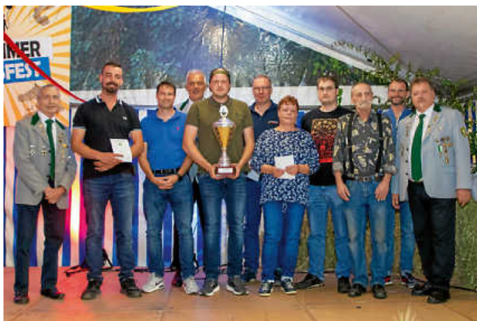
Stadt Pokal: Der heiß begehrte Stadt Pokal ging in diesem Jahr an das Team „Eckenberg 1“