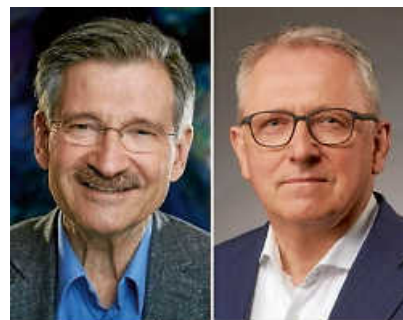
Hermann Otto Solms

Es scheint kaum vorstellbar, dass man die großen Probleme der heutigen Zeit durch geduldiges Verhandeln eines Kompromisses lösen kann. So wächst der Ruf nach radikalen Schritten. Je radikaler jedoch die Politik agiert, desto mehr Menschen stößt sie vor den Kopf. Das führt schlimmsten-