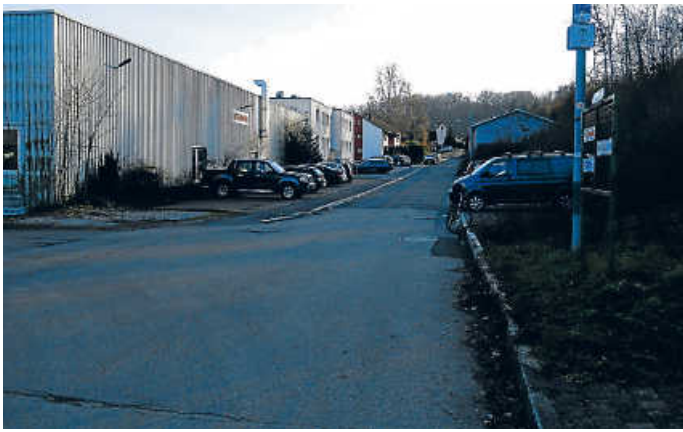
T-Kreuzung bei der Firma Schimmel in der Industriestraße Richtung Rittersbrunnenstraße