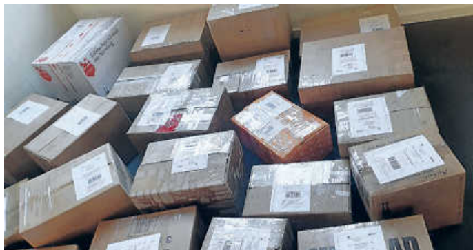
Teil der Pakete kurz vor dem Versand

Eine unglaublich gute Resonanz erfährt die Hilfsaktion „Humanitäre Hilfe Ukraine“ des Turnvereins. Über 40 Päckchen und Pakete wurden in den vergangenen Tagen an der Festhalle abgegeben. Die prall gefüllten Kartons mit Lebensmitteln, Hygienebedarf und medizinischen Materialien sind nun mit DHL auf dem Weg in die Ukraine.