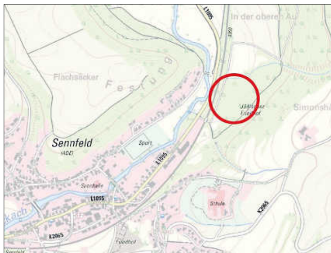
Karte: Lage des Feuchtbiotops in Adelsheim-Sennfeld, ©LUBW