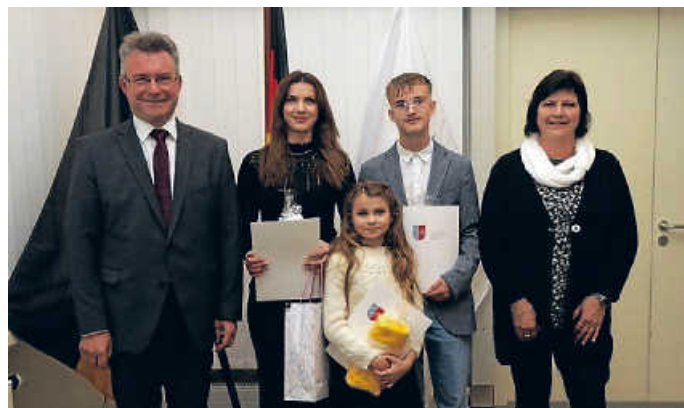
Einbürgerungsfeier am 30.11.2022 in Walldürn