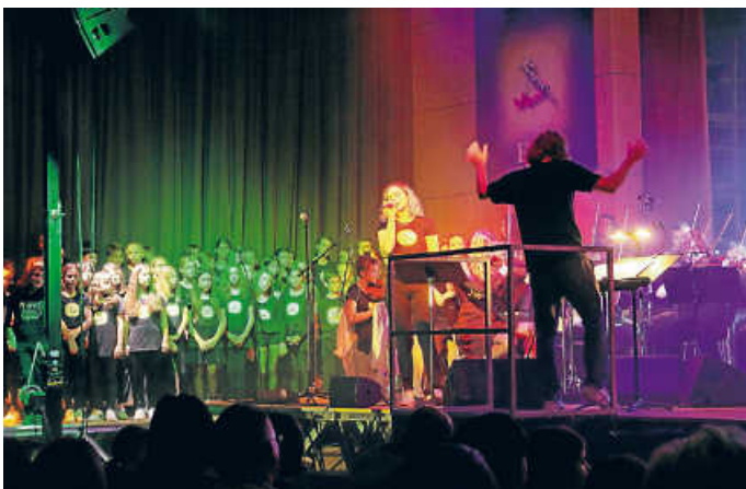
„Smoke on the water“ wurde am Sonntag als weitere Zugabe eingefordert.