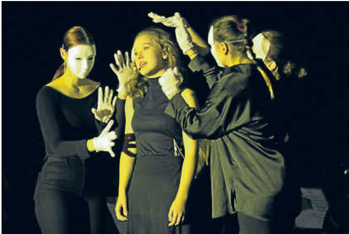
Die Schülerinnen des Theaterkurses präsentierten die deutschen Übersetzungen.

Bildeindrücke und alle Titel sind auf der Homepage der Schule zu finden (ebg.schule). (Text und Fotos: jpw)