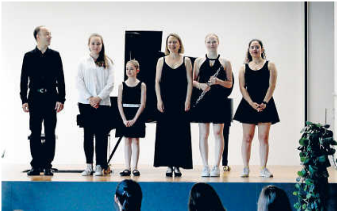
Schülerinnen und InstrumentallehrerIn erfüllten die Kleine Aula durch ihr Spiel