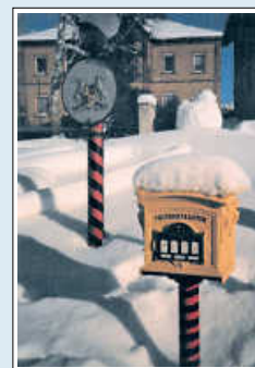
Heimatbrief Adelsheim 2021

Ab sofort ist der Heimatbrief im Bürgerbüro des Rathauses, bei Spielwaren Friedlein, in der Baual-Apotheke und beim Schreibwarengeschäft Hohmann zu 1,50 € erhältlich.